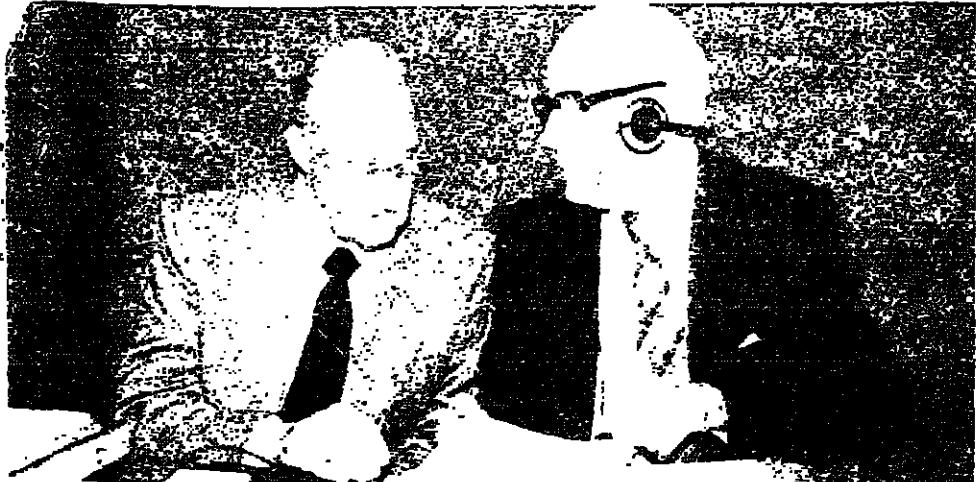
جواو هافيلانج ( ال اليسار ) ونائبه كالفن متفان داما في كل الامور

وقد طالب بعض الصحف الهولندية بتعيين شخص ( من الممكن ان يكون نادراً وفضياً ) يلزم ليريوتس ويشرف على اعدائه ويحل المباريات التي يخوضها المنتخب الهولندي في الايام القادمة قبل موعد كأس موندول ( ٩٠ ) كيف تأملت تونديل ٩٠ علما بان منتخب هولندا خسر ٦ مباريات في التصفيات ليقابل النهائيات